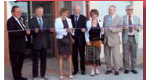
Inauguration du pôle multi-accueil de Saint-Just le 15 septembre.

Ce pôle est géré en délégation de service public par l'association Léo Lagrange (qui gère déjà Ceyzériat).